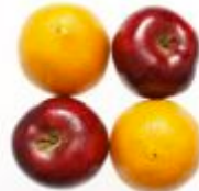
Apples and oranges