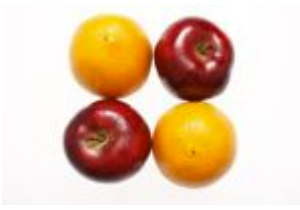
Apples and oranges